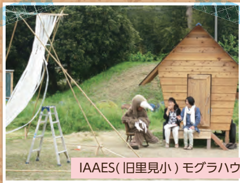
IAAES(旧里見小)モグラハウス