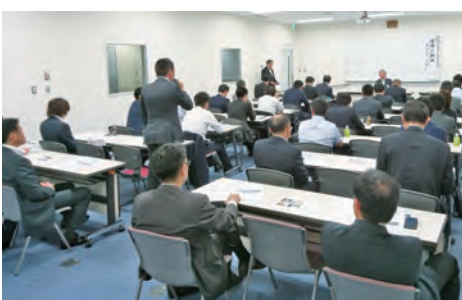
積極的に質問をする参加者