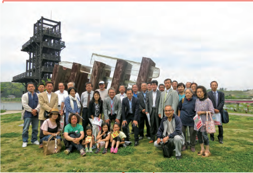
いちほらアート×ミックス2017視察研修