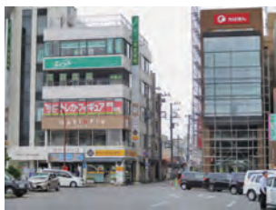
ホビーショップDICE 住所 市原市五井2-8-31 時田ビル3F

最後に市原商工会議所の会員に向けてひとこと 子供のころ遊んだ超合金やプラモデルなどのホビーが筆筒に眠っているようでしたら、買い取りさせていただきます。創業したてですが、よろしくお願ひします。