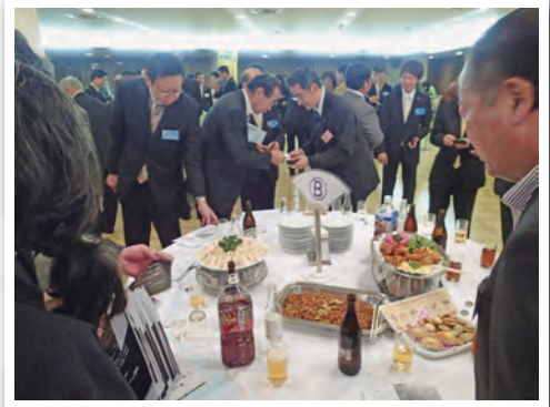
前回は350名超の参加