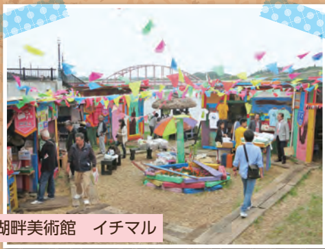
湖畔美術館 イチマル